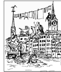
Einwohnerverein Altstadt links der Limmat