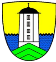
Quartierverein Selnau- City