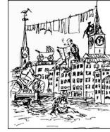
Einwohnerverein Altstadt links der Limmat