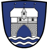
Quartierverein Zürich 1 rechts der Limmat